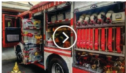
39enne ustionato in azienda. Trasportato in ospedale ad Udine