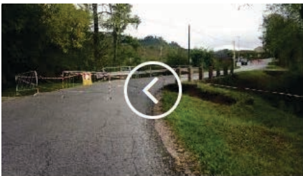
Verifiche causa maltempo sulle strade della Marca da parte dei tecnici dell'Ente